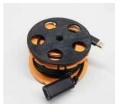
高所用延長ケーブル (最大8m)