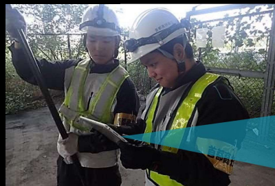
手元のタブレットにて カメラ映像を確認