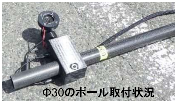
Φ30のポール取付状況