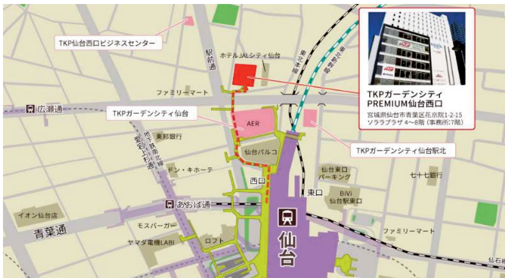
TKP ガーデンシティ p r e m i u m 仙台西口 位置図

※なお、令和6年度は、後期（11月初旬ころ）にも石巻及び仙台にて開催する予定がございます。